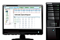
Transit Scheduling /Video Client