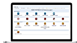
Platform Data Report